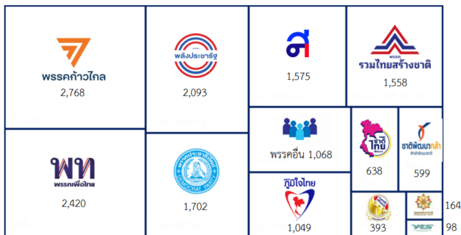
การให้พื้นที่ผู้สมัครนำเสนอของพรรค (นาทีข่าว)

ในด้านติดตามความคิดเห็นของผู้ชมไทยพีบีเอส (Feedback) ที่มีต่อการนำเสนอข่าวเลือกตั้ง 2566 ของไทยพีบีเอส พบว่า มีผู้ชมแสดงความคิดเห็นผ่านช่องทางรับฟังทางออนไลน์ของไทยพีบีเอส รวมทั้งหมดจำนวน 5,062 ความคิดเห็น เป็นความคิดเห็นต่อบทบาทการนำเสนอข่าวสารของไทยพีบีเอสจำนวน 3,593 ความคิดเห็น