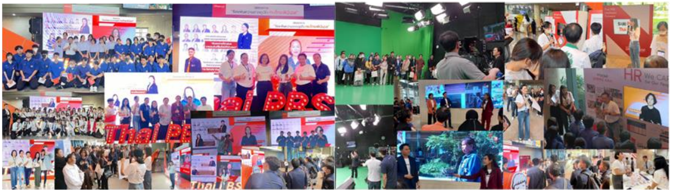
DNA ของคนสื่อสารณะที่ถ่ายทอดผ่านภารกิจและหน้าที่ความรับผิดชอบของแต่ละหน่วยงานให้แก่ประชาชนที่มาเยี่ยมชม

บทบาทใหม่ที่ปรับเปลี่ยนขึ้นมา นี้ นับเป็นความท้าทายสำหรับ ส.ส.ท. ซึ่งเป็นองค์กรที่มีวัฒนธรรมและวิธีคิด (Mindset) แบบผลิตเพื่อเผยแพร่ทางสื่อโทรทัศน์เป็นช่องทางหลักก่อน ดังนั้น การกำหนดยุทธศาสตร์สำคัญในแผนบริหารกิจการ ปี พ.ศ.2567 และการนำแนวทางของ Digital Transformation มาเป็นกรอบทิศทาง ทั้งในด้านเทคโนโลยี คน และ การบริหารการเงิน/รูปแบบกิจการ จึงเป็นการวางเป้าหมายและแนวทางไว้ค่อนข้างชัดเจนแล้ว ขึ้นอยู่กับความสามารถและความพร้อมในการปรับตัวของผู้บริหารและพนักงานทั้งองค์การ ในการขับเคลื่อนไปตามแนวทางดังกล่าว ซึ่งทีมบริหารจะให้ความสำคัญ และแสวงหารูปแบบ กลยุทธ์ เพื่อใช้ผลักดัน สร้างการมีส่วนร่วมกับพนักงานให้ได้อย่างเต็มที่ โดยจะมีการสรุปและทบทวนวิธีการหรือแนวทางที่ใช้ในทุก ๆ ไตรมาส